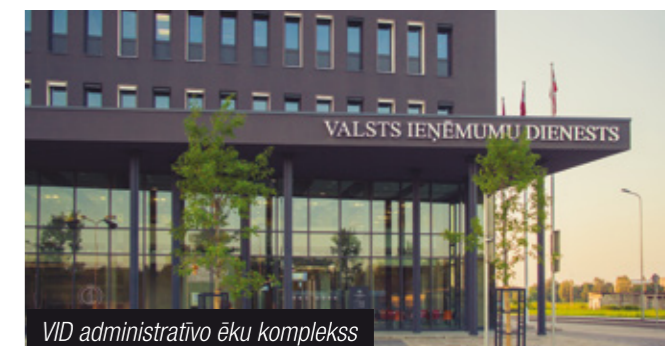
VID administratīvo ēku komplekss