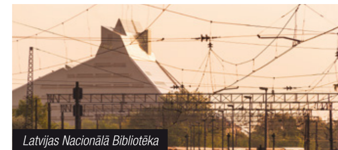
Latvijas Nacionālā Bibliotēka